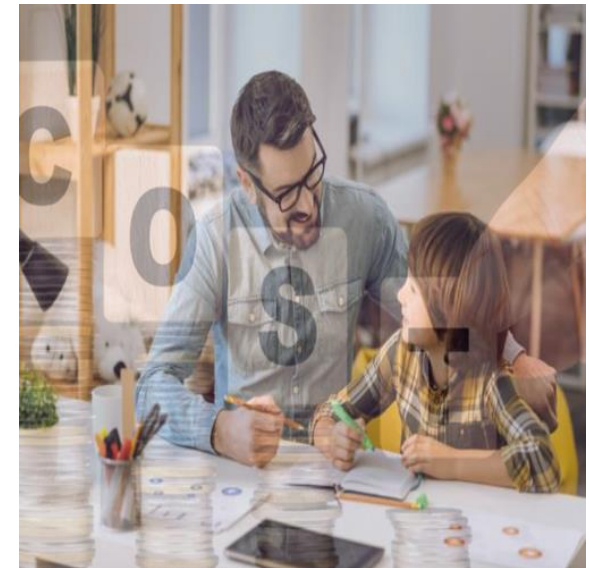
[사용자 배경 이미지 합성]